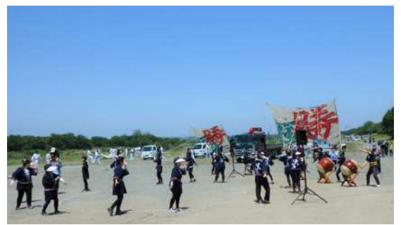
前回の様子（相模の大凧まつり写真コンテスト入選作品より）