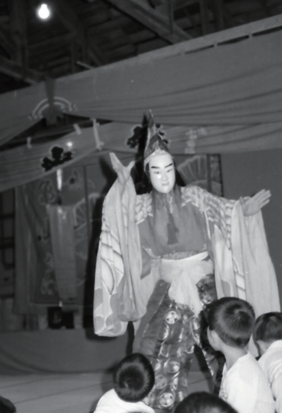
「三番叟」(下九沢御嶽神社) 昭和58(1983)年撮影