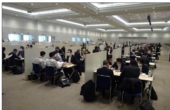
令和5年度に実施した「九都県市合同商談会2024」の商談風景 (会場: パシフィコ横浜 アネックスホール)

首都圏産業の国際競争力の強化を図るため、平成20年度から九都県市(埼玉県、千葉県、東京都、神奈川県、横浜市、川崎市、千葉市、さいたま市、相模原市)が連携して合同商談会を開催し、今回で第17回目を迎えます。