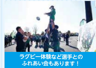
ラグビー体験など選手との ふれあい会もあります!