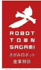
ロボット産業特区 （神奈川県）