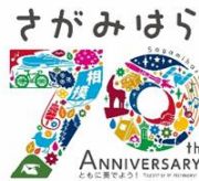
市制施行70周年 （相模原市）