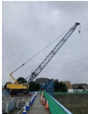
大型重機展示 （施工会社）