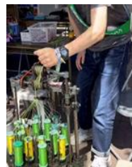
組紐体験 （相模原橋本RC）