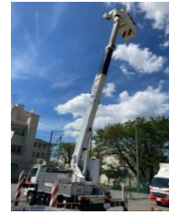
高所作業車 （東京電力PG）