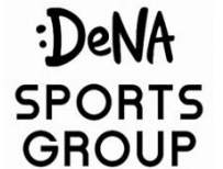
DeNAスポーツ グループ