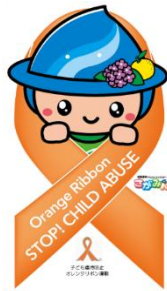
マグネットシート