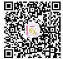
ロゴマーク使用要領