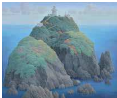
成田禎介《燈台の島》