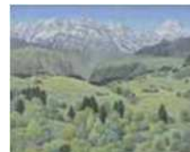
成田禎介《アルプスの高原》