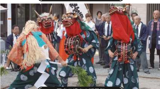
田名八幡宮の獅子舞