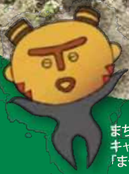
まちだ縄文 キャラクター 「まっくう」