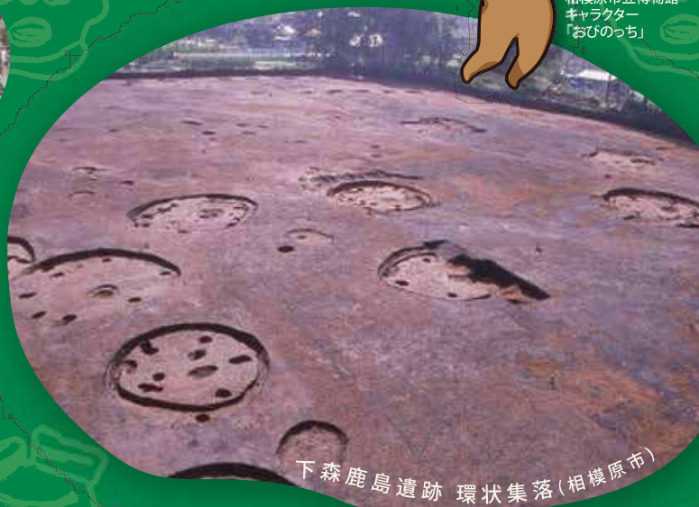
下森鹿島遺跡 環状集落(相模原市)