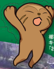
相模原市立博物館 キャラクター 「おひのっち」