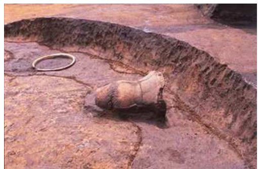
下森鹿島遺跡(南区)の縄文土器出土状況