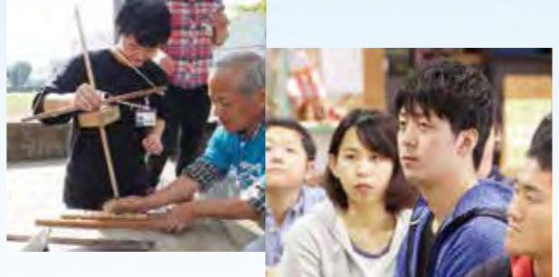
「さがみ風っ子教師塾」の様子。この日は、市内在学の児童・生徒が体験学習を行う「相模川ヒレジグ若あゆ」で実習を行った