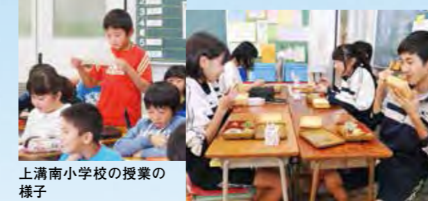
上溝南小学校の授業の様子 新町中学校の昼食の時の様子。生徒たちは弁当や給食をしっかりと食べて、午後の授業も元気に取り組んでいる

の教員がいなくなったら荒れてしまうのではダメ。学校、家庭、地域社会が一つになって教育を考えていく、そんな持続する環境づくりが求められるのではないだろうか。