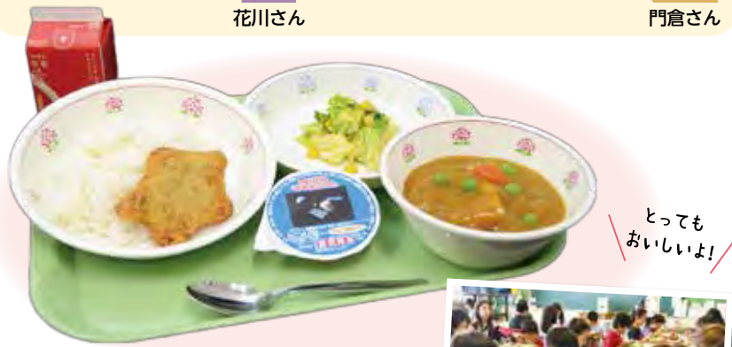
とってもおいしいよ!