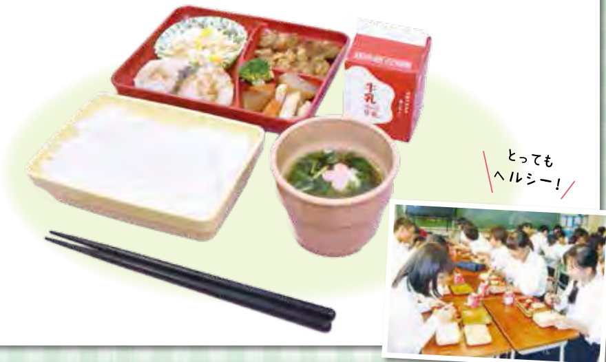
とってもヘルシー!

デリバリー方式の中学校給食に汁物が登場します(給食費は変わりません)。小学校の給食同様、市の栄養士が献立作成・食材発注を行い、生徒の栄養バランスを考慮したおいしい給食作りに取り組んでいます。