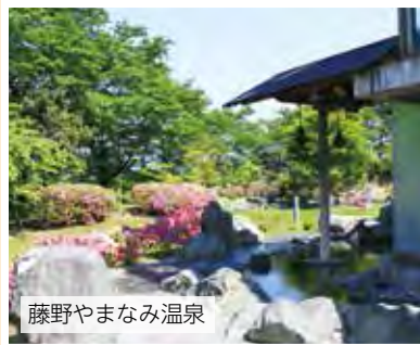
藤野やまなみ温泉