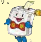
市選挙啓発キャラクター「アップくん」