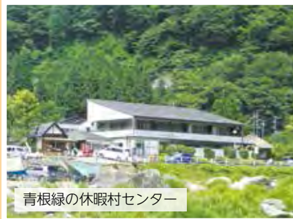
青根緑の休暇村センター