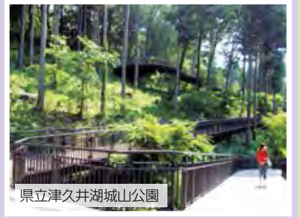
県立津久井湖城山公園

根小屋地区乗合タクシーの愛称が決定しました！ 4月から「くっしー号」として運行中です。