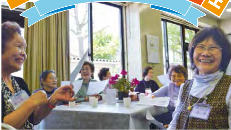
会話を通して、自然と笑顔になる参加者

カフェは、星が丘公民館の高齢者学級OBを中心としたスタッフにより、昨年5月から毎月1回、同公民館で開催しています。