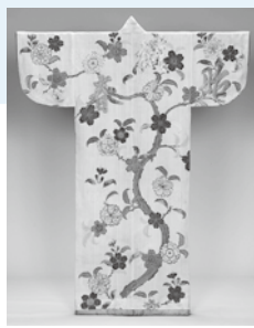
「桜樹詠文字模様小袖」

時 2月23日(土)～3月2日(土) 午前10時～午後5時(入館は午後4時30分まで) 休館日 2月27日(水)・28日(木) 会 女子美アートミュージアム(南区麻溝台)