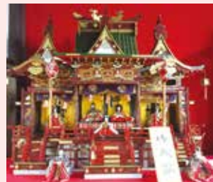
現在では珍しい御殿雛