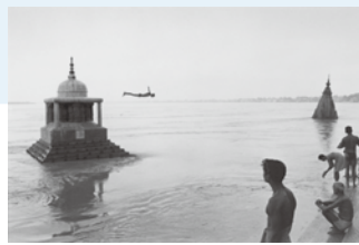
鬼海弘雄 「しあわせ インド大地の子どもたち」

時 2月16日(土)～3月10日(日) 午前10時～午後6時 休館日 2月25日(月)