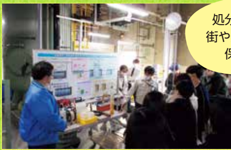
大学生の見学会時の様子