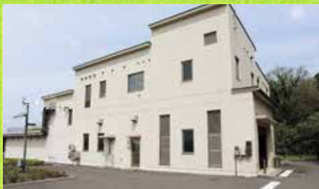
地下水の水位などを常時監視。内部には資料展示コーナーもあり