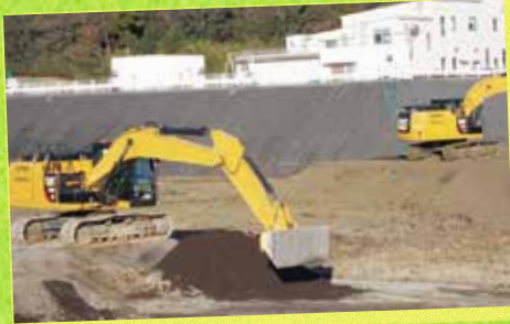
灰などを埋め立てた後に、土をかぶせている様子

A ショベルカーで平らになるように埋め立てています。北・南清掃工場から処分場に運ばれる灰などの量は、1日に10tトラック約10台分です。