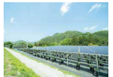
さがみこベリーガーデン