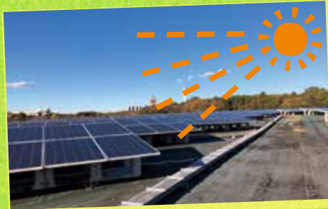
約8,000枚の太陽光パネルが並ぶノジマメガソーラーパーク

A 埋め立てた跡地は、有効に活用します。第1期整備地はメガソーラーを導入し、太陽光発電で再生可能エネルギーを作っています。また、全国的には、公園として利用している例もあります。