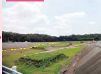
▲地表面近くまで埋め立てが進む現在

今年度から、埋め立て容量を増やす工事を段階的に実施し、令和19年度途中まで利用予定