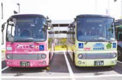
▲(左)大野北地区の「ピンくる号」 (右)大沢地区の「せせらぎ号」