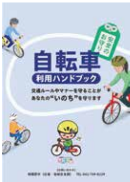
自転車利用ハンドブック ※市庁からも閲覧可

補助金額 上限3,000円(1人1個まで。購入金額が3,000円未満の場合は、購入金額) ※申込順。予算額(1万個分)に達した時点で、受け付け終了 ☎交通・地域安全課、各区役所地域振興課・まちづくりセンター(橋本・中央6地区・大野南を除く)・出張所・公民館(沢井を除く) ※市庁にも掲載 ☎11月30日(必着)までに、市庁から。 ※市庁からの申請が難しい場合は申請書などを交通・地域安全課へ