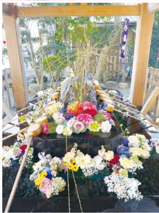
色鮮やかな花々に心も癒やされます (写真は1月の亀ヶ池八幡宮)

「中央区花手水」を知っていますか。中央区役所では、令和4年度から区の魅力づくりの一つとして、季節ごとに「中央区花手水」を実施しています。スケジュールは、中央区ホームページ等でお知らせします。今回は、どんな花手水?華やかな花手水に乞うご期待!