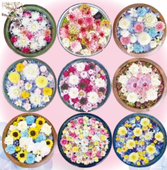
季節ごとの花やテーマで彩った花手水

花手水とは、手や口を清めるための手水舎や、睡蓮鉢に色とりどりの花を浮かべ、飾ったもの