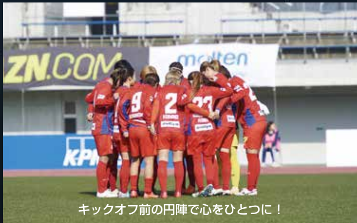
キックオフ前の円陣で心をひとつに!

ノジマステラ神奈川相模原は、ノジマフットボールパーク(南区新戸)に拠点を構える市ホームタウンチーム。チーム名のステラはイタリア語で星という意味で、女子サッカーの普及・発展に貢献し、神奈川の「星」を目指します。