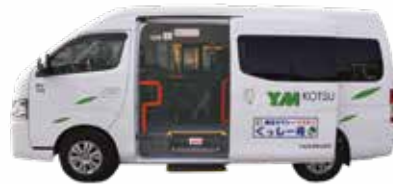
▲根小屋地区の「くっしー号」 ワゴン型タクシーで車内はゆったり広々