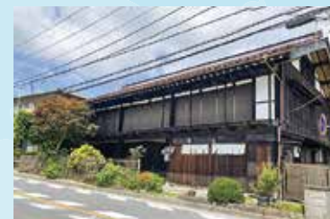
古民家(宿場時代の旅籠の一つ)

基本情報 ①小原宿本陣②小原の郷 所在地 ①緑区小原698-1②緑区小原711-2 開館時間 9時30分～16時(②は16時30分まで) 休館日 月曜日(祝日等の場合は直後の日)、12月29日～1月4日 問い合わせ ☎042-684-4780②☎042-684-5858